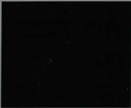
P7507 - Noir