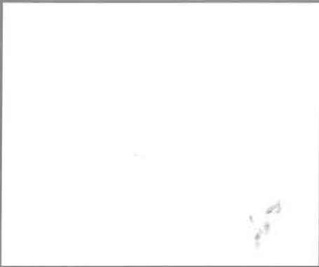
P8757 - Blanc