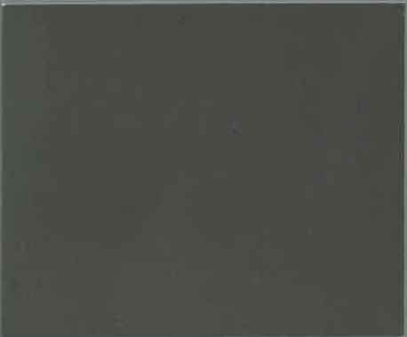
MEMDRYCLEARKIT - Transparent